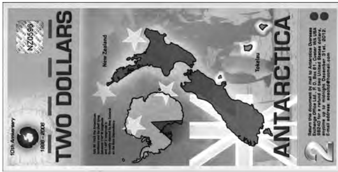
Abb. 2b: 2 Dollar Antarktis 2007 RS

Rückseite: Staatsflagge und Landkarten neuseeländischer Gebiete