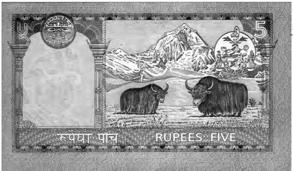
Abb. 4: Ausgegebene Papierbanknote, 5 Rupees, Rückseite