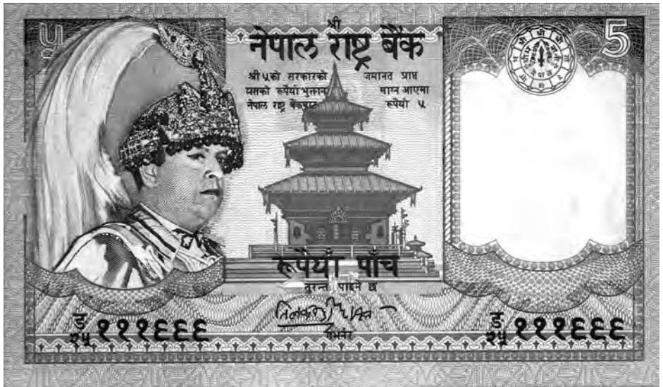
Abb. 3: Ausgegebene Papierbanknote, 5 Rupees, Vorderseite