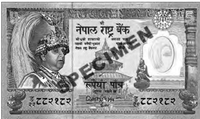
Abb. 1: Probedruck Polymernote, 5 Rupees, Vorderseite

Es handelt sich um eine bisher unbekannte Polymerbanknote.