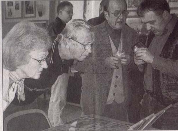
Interessenten bestaunen die Vielfalt der Münzen in Penkun.